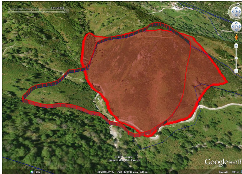
FIGURE 1 – Une simulation d’un feu de forêt de 2003, dans la commune de San-Giovanni-di-Moriani (Corse). Le contour simulé est représenté par le front rouge avec une extension verticale ; la zone brûlée observée est représentée par la surface rouge.